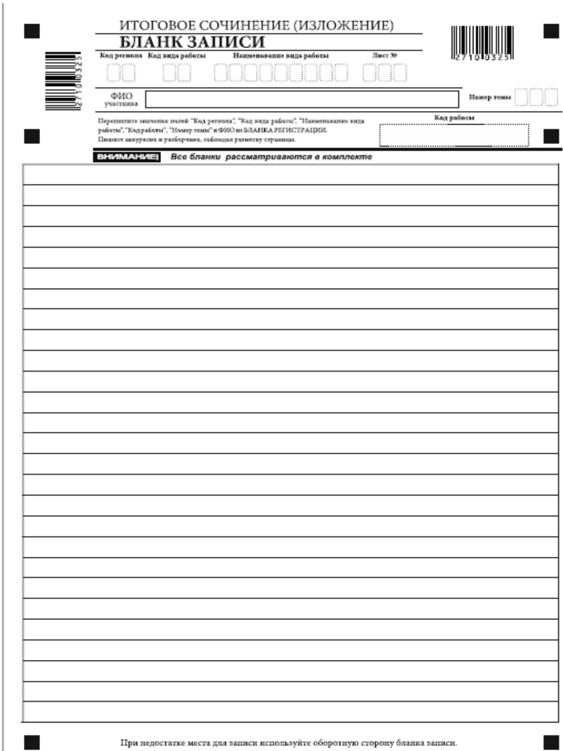
Рис. 5. Бланк записи

В случае использования двустороннего бланка записи при недостатке места для оформления итогового сочинения (изложения) на лицевой стороне бланка записи участник может продолжить записи на оборотной стороне бланка (рис. 6), сделав внизу лицевой стороны запись «смотри на обороте».