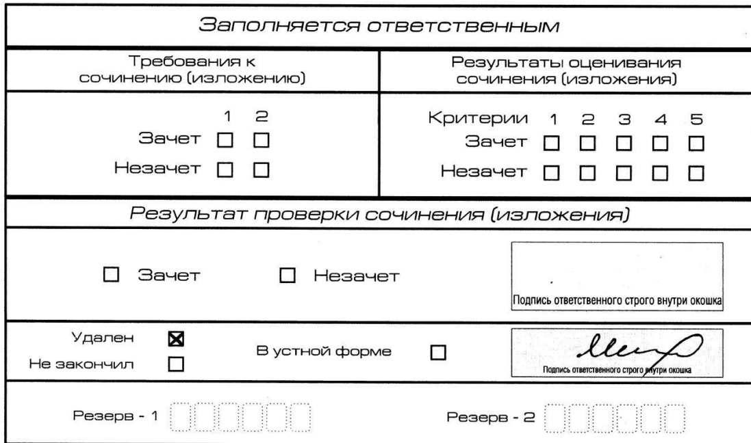
Рис. 12. Заполнение полей нижней части бланка регистрации (удаление с экзамена)