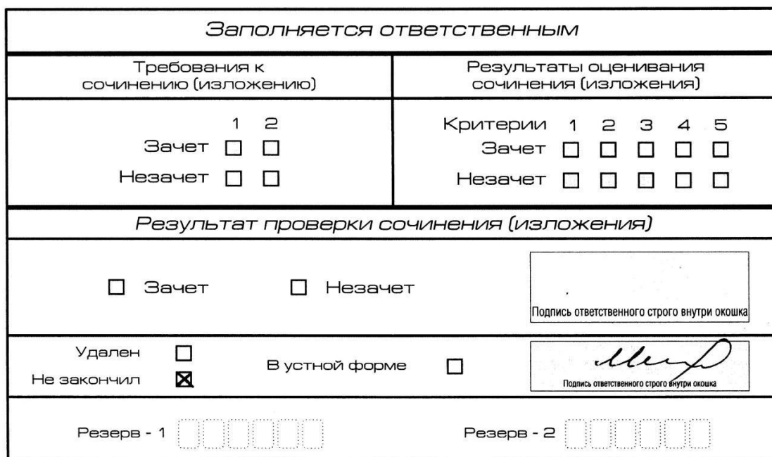
Рис. 11. Заполнение полей нижней части бланка регистрации (участник не закончил написание сочинения (изложения) по уважительным причинам)