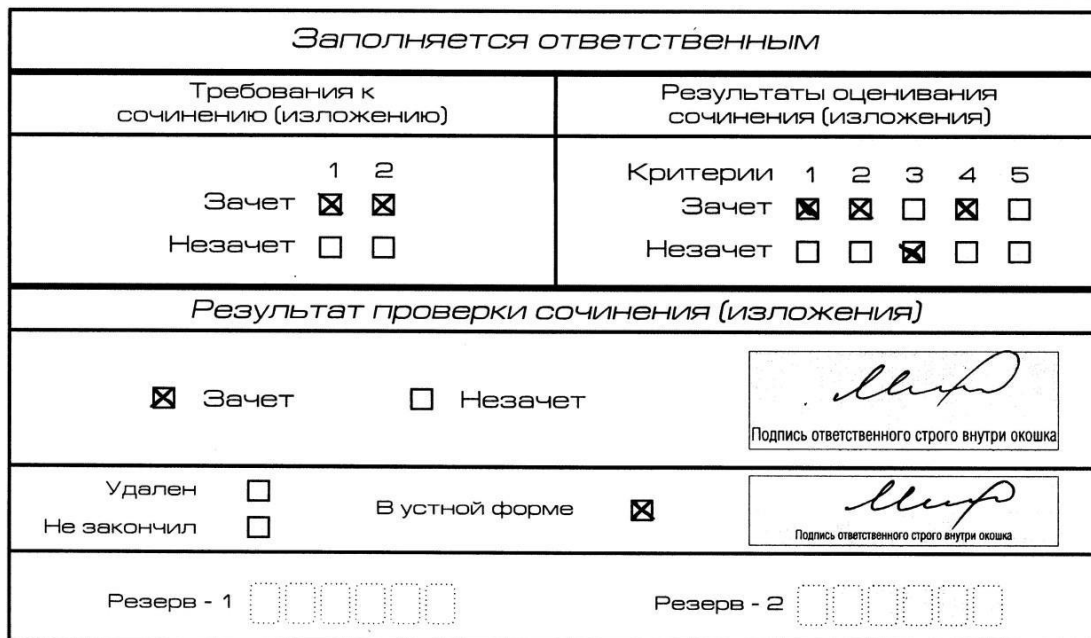
Рис. 10. Область для оценки работы сочинения (изложения) в устной форме

После окончания заполнения бланка регистрации ответственное лицо ставит свою подпись в специально отведенном для этого поле.