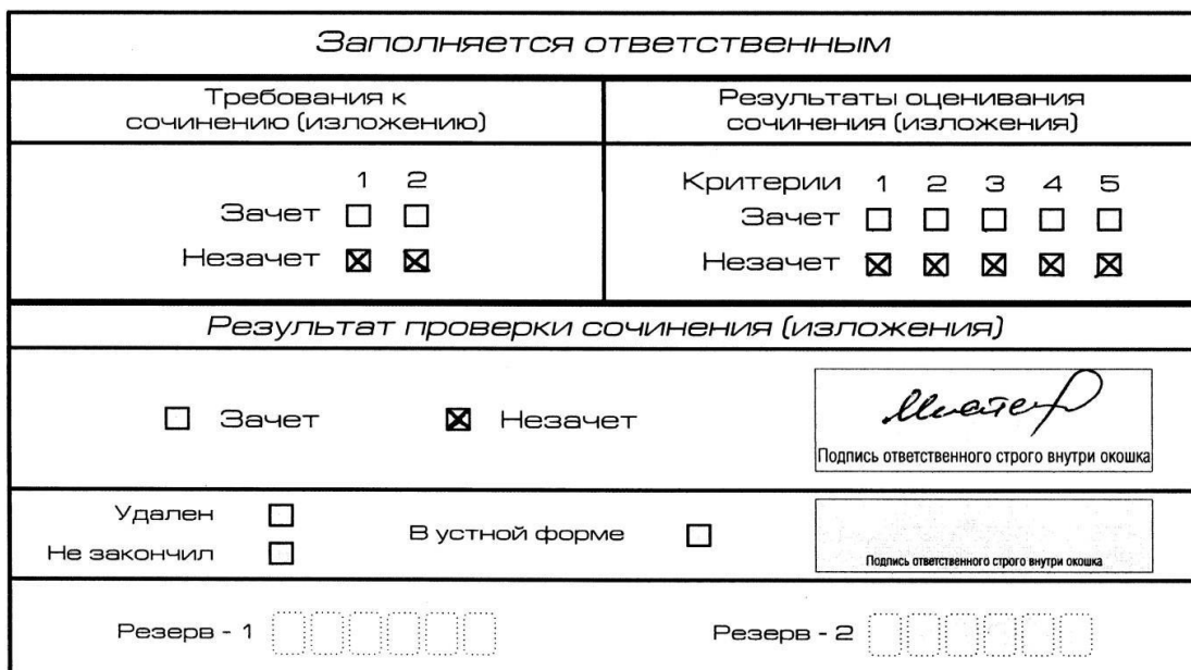
Рис. 7. Область для оценки работы